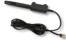
USB 轉無線 Wi-Fi